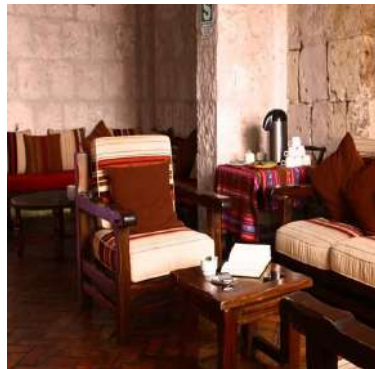
AREQUIPA: Posada Monasterio