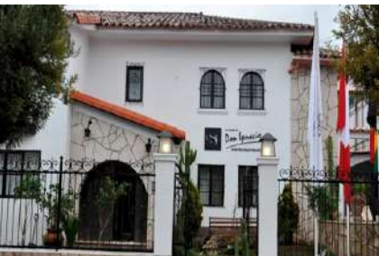
CUSCO: Casa Don Ignacio