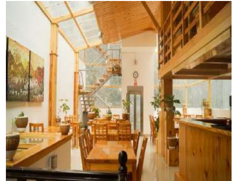
MACHU PICCHU: Waman