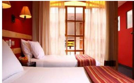
PUNO: Casa Andina Tikarani